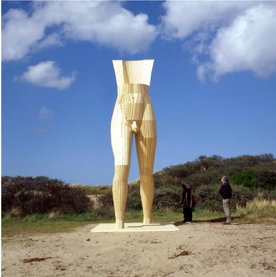
Opus 28: Christophorus , 2002-2003, 300 x 421 x 690 cm, collectie Gemeente De Panne, België