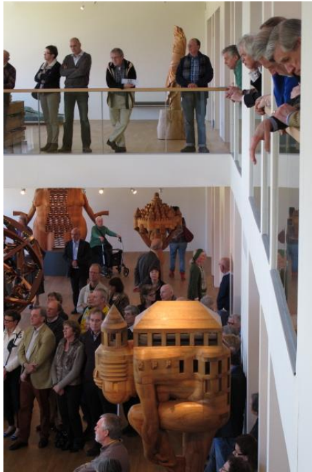
Opening Taal in Beeld

Bij de tentoonstelling is de oevrecatalogus Gerhard Lentink verschenen: 198 pag., 130 afbeeldingen waarvan 78 in kleur, voorwoord Loek Dijkman, inleiding Wouter Welling. De teksten bij de beelden afzonderlijk zijn van mijn hand. Het boek beschouw ik als de pendant van het autobiografische Anatopen dat in 2009 verscheen: de catalogus belicht het werk, Anatopen mijn leven en denkwereld.