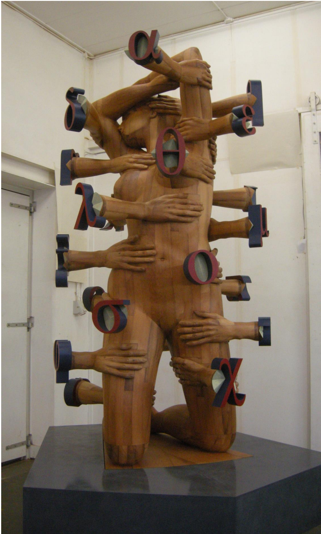
Opus 38: Redites-moi des choses tendres , 2013-2014, 169 x 186 x 276 cm