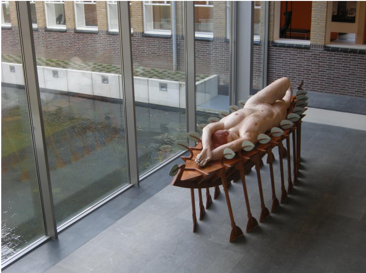
Immer leiser wird mein Schlummer (opus 22) in Beeldengalerij Het Depot, Wageningen