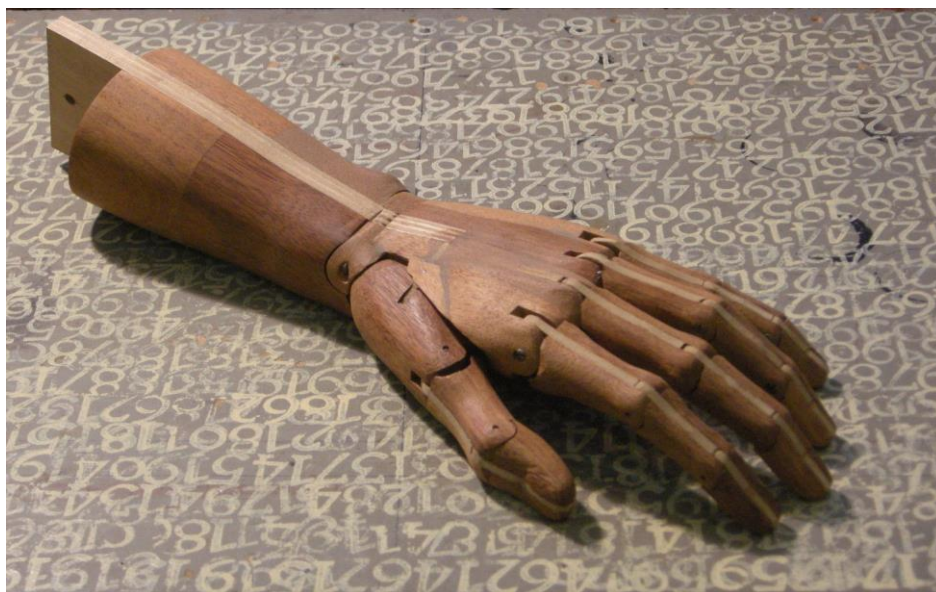
5 juni 2013: houten ledenmodel voor de strelende handen van Redites-moi ..

*** Het is me wel vaker overkomen dat collega's haarfijn de zwakke plekken in een ontwerp weten te benoemen, die ik in de ontwerpfase half bewust ook wel zag, om ze vervolgens uit mentale luiheid te verdringen omdat ik niet meteen een adequate oplossing zag. Wanneer deze zwaktes dan weer voor het voetlicht gebracht worden, voel ik me betrappt en rest mij niets anders dan het gesignaleerde probleem aan te pakken.