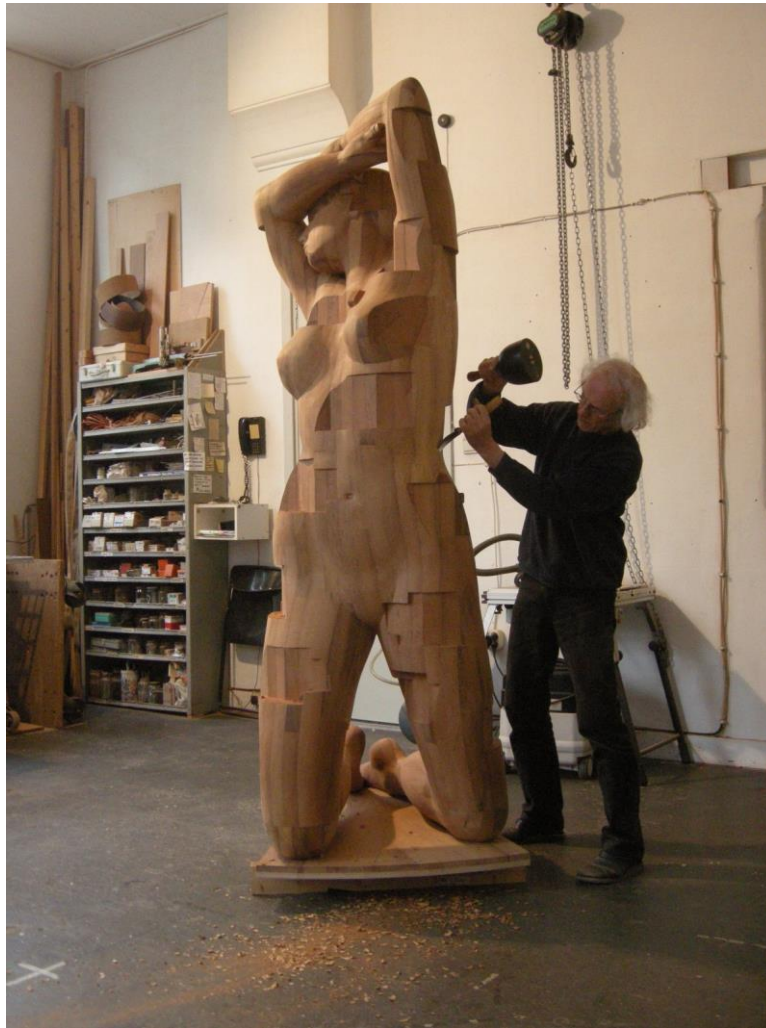
29 april 2014: Redites-moi des choses tendres , voltooiing centrale figuur

Ook in de vorm van de sokkel ben ik afgeweken van het oorspronkelijk ontwerp. Toen ik de tors eenmaal rechtop geplaatst had op een balkenonderstel, zag ik dat de sokkel twintig centimeter lager moest worden om de toeschouwer intiemer te betrekken bij het spel van elkaar ontmoetende horizontalen en verticalen. (Het beeld kan opgevat worden als een ‘organische Mondriaan’, een barokke Victory Boogie Woogie .) Tegelijkertijd moest, om de fragiele letters aan de buitenzijde te beschermen tegen beschadiging, het horizontale sokkeloppervlak sterk vergroot worden. Om de vijfhoekige sokkel niet te zwaar te laten ogen voorzag ik deze van een 15 cm terugwijkende plint, waardoor beeld en sokkel lijken te zweven boven het vloeroppervlak.