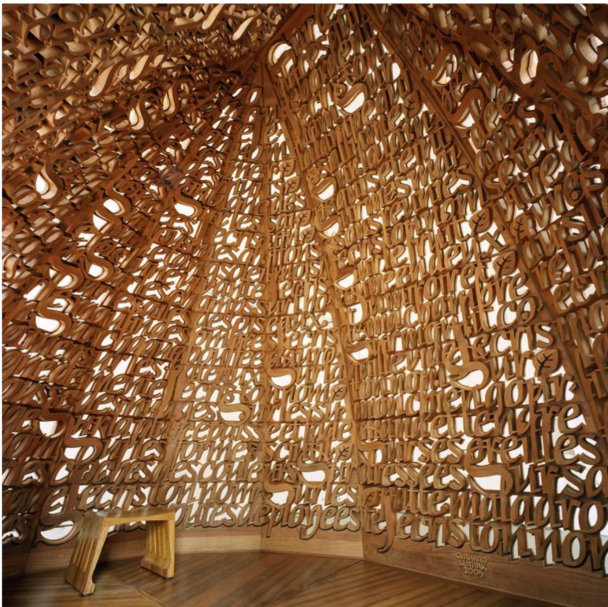
Opus 30, WaltersHuis, 2000-2005, 420 x 345 x 432 cm, demontabele kapel, waarvan de wanden opgebouwd zijn uit de tekst van het liefdesgedicht Liberté van Paul Éluard (1895-1952), interieuropname