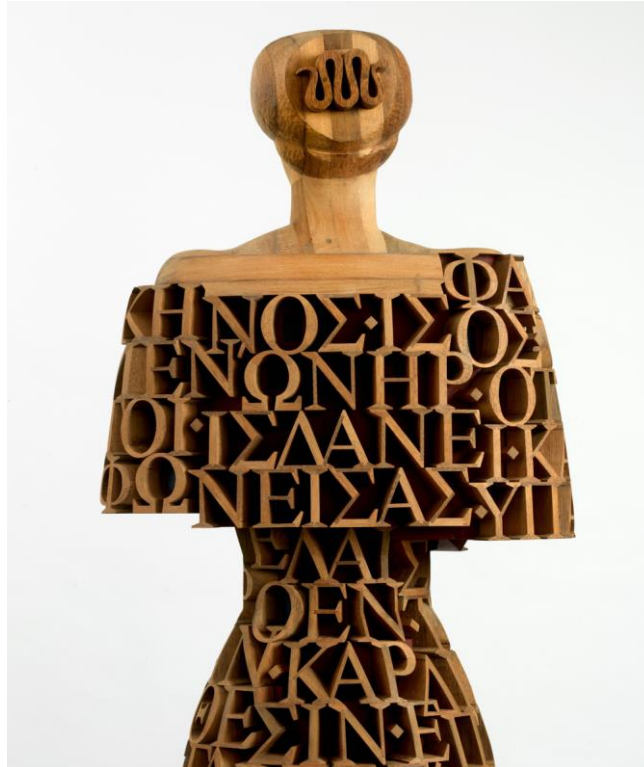
Opus 37: Sappho , detail

De eerste helft van mei assisteerde ik vriend en collega Gertjan Evenhuis bij de opbouw van vijf beelden (vier van graniet, één van hout) voor de Schweizerische Triennale der Skulptur in Bad Ragaz, Zwitserland. En in november zouden we weer samen op pad gaan naar dit kuuroord, nu voor de demontage van de werken.