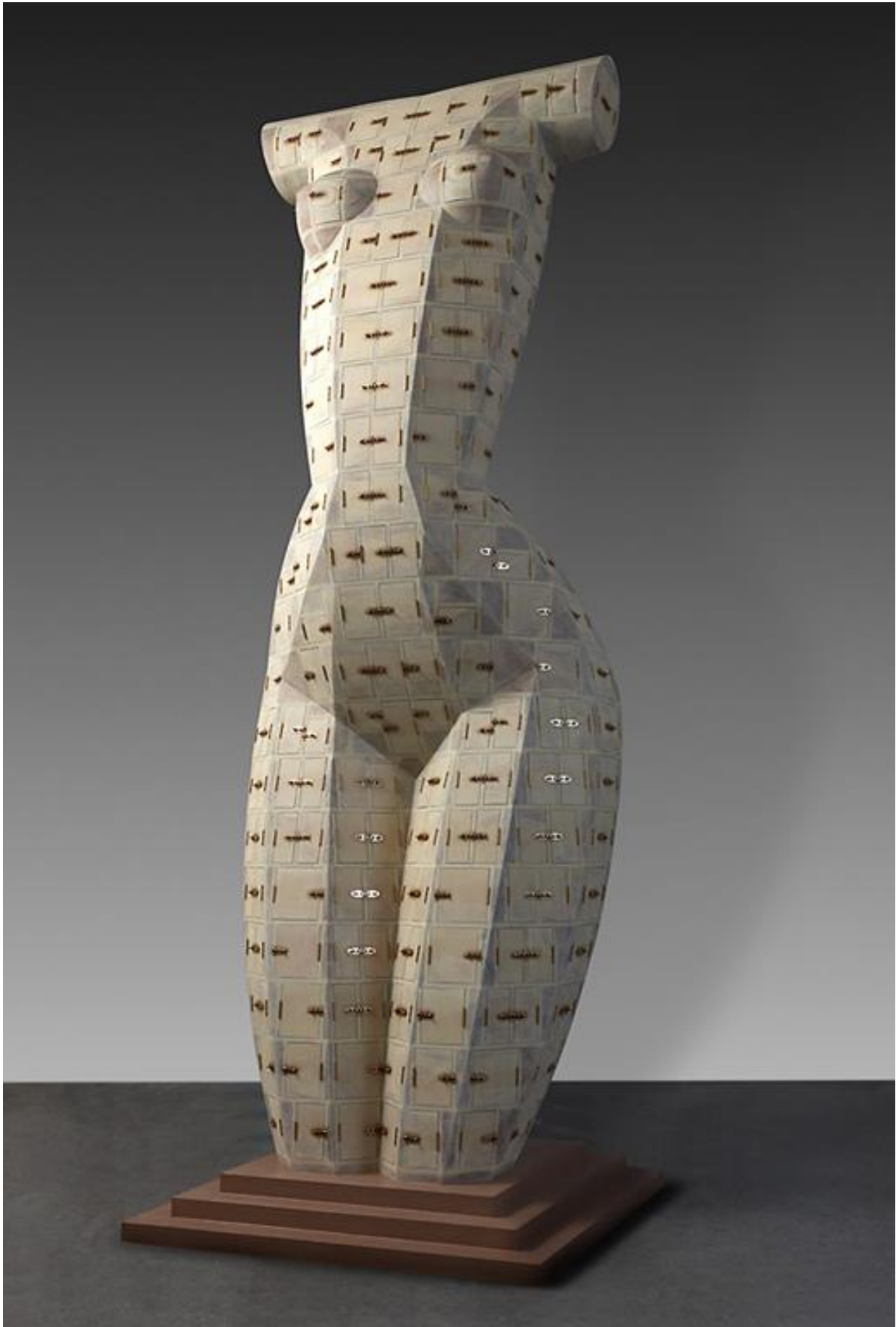
Opus 35: Madonna der dagen , 2009-2010, 132 x 132 x 388 cm