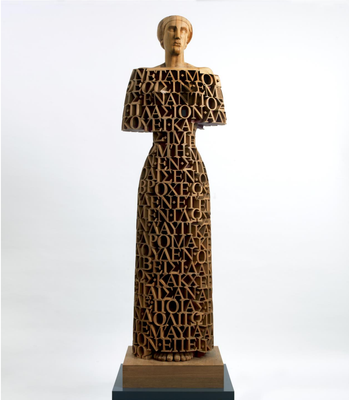
Opus 37: Sappho , 2011-2012, 69 x 88 x 301 cm

Eind juli en begin augustus stelde ik een selectie foto's van het landschapsproject Viaggio Settentrionale (opus 20) tentoon in een kleine galerie in Saugues (Haute-Loire), een pittoresk stadje aan de pilgrimsroute van Le Puy-en-Velay naar Santiago de Compostela. Een medestudent destijds van de academie Sint Joost, Breda, die zich tien jaar geleden in Frankrijk vestigde, had, als 'artistiek adviseur' van de zomertentoonstellingenreeks in het stadje, mij uitgenodigd.